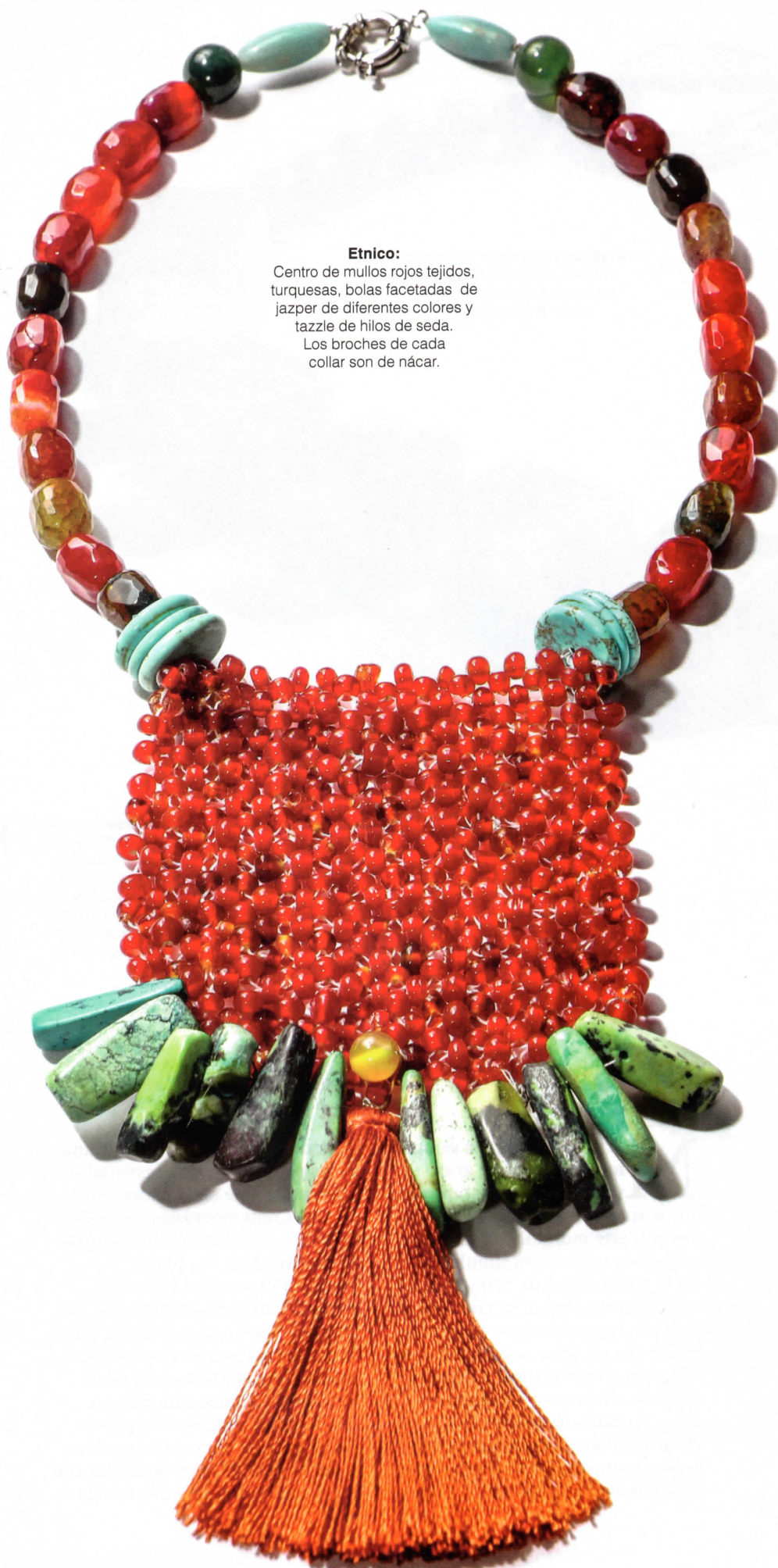
Etnico: Centro de mullos rojos tejidos, turquesas, bolas facetadas de jazper de diferentes colores y tassel de hilos de seda. Los broches de cada collar son de nácar.