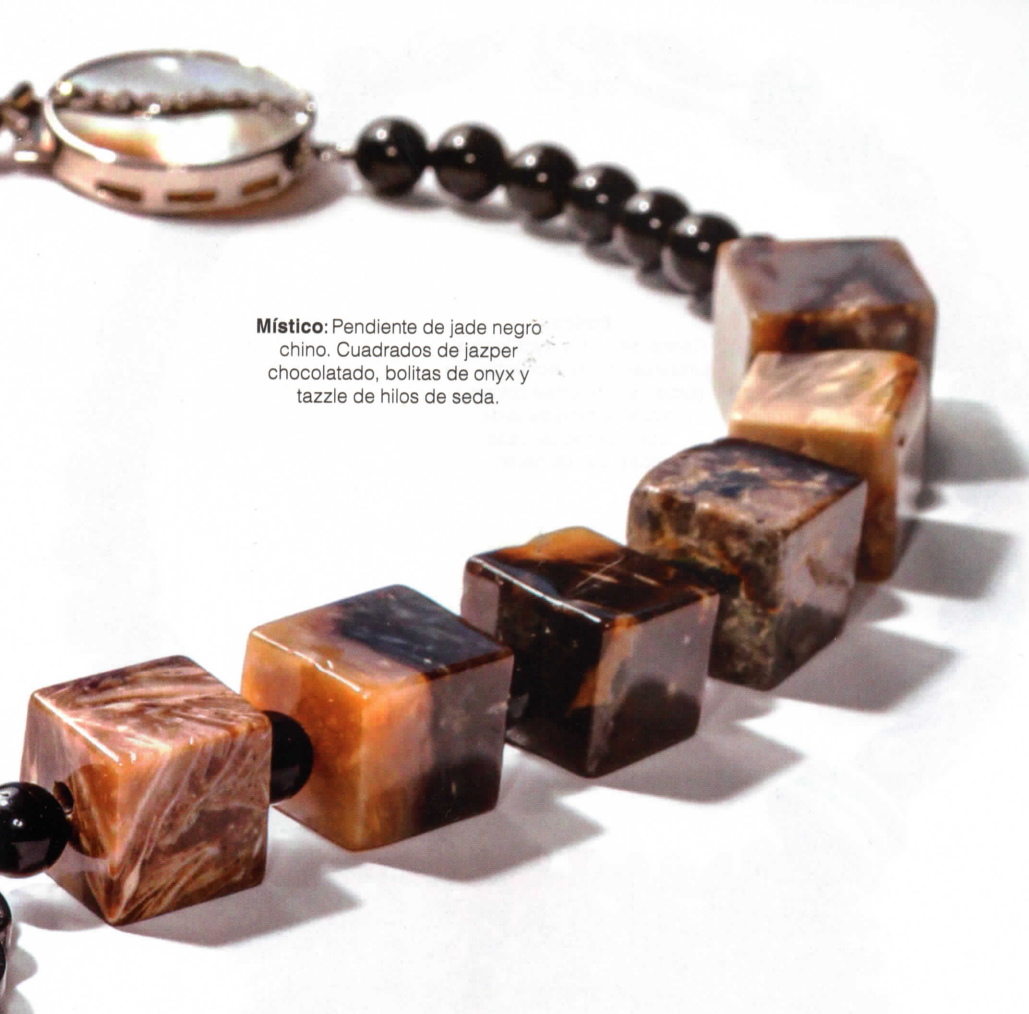
Místico: Pendiente de jade negro chino. Cuadrados de jazper chocolateado, bolitas de onyx y tazzle de hilos de seda.