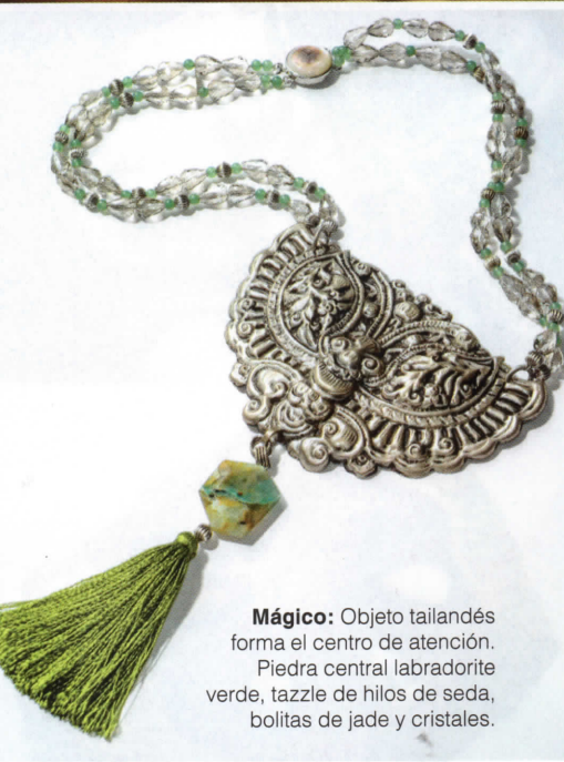
Mágico: Objeto tailandés forma el centro de atención. Piedra central labradorite verde, tassel de hilos de seda, bolitas de jade y cristales.